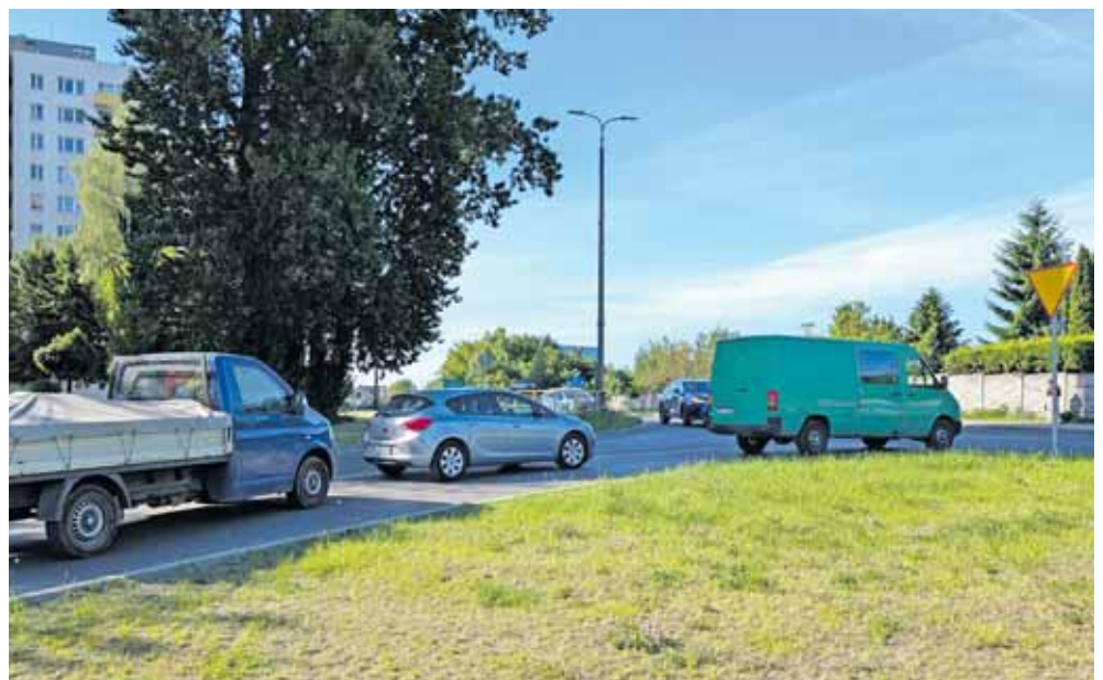
Kierowcy twierdzą, że po remoncie jest jeszcze gorzej

Zarząd Dróg Powiatowych w Tarnowskich Górach tłumaczy, że skrzyżowanie zostało niedawno przebudowane w ramach inwestycji dotyczącej budowy infrastruktury rowerowej realizowanej przez gminę Tarnowskie Góry. Obecnie zadanie objęte jest okresem trwałości projektu, co uniemożliwia wprowadzanie zmian w wykonanej infrastrukturze, gdyż mogłoby to skutkować