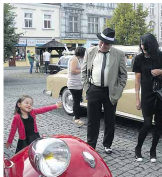
Jedną z flagowych imprez, w których organizację angażuje się Automobilklub, jest zjazd zabytkowych pojazdów w Tarnowskich Górach