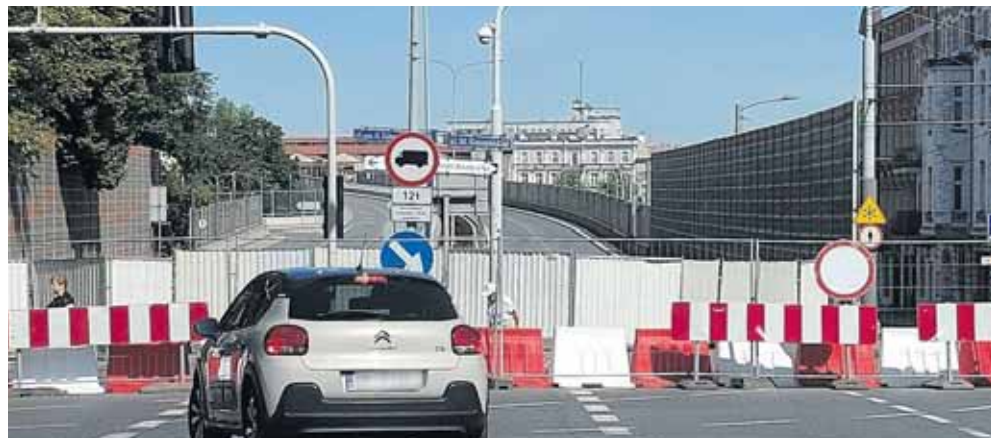
Estakada nadaje się tylko do wyburzenia