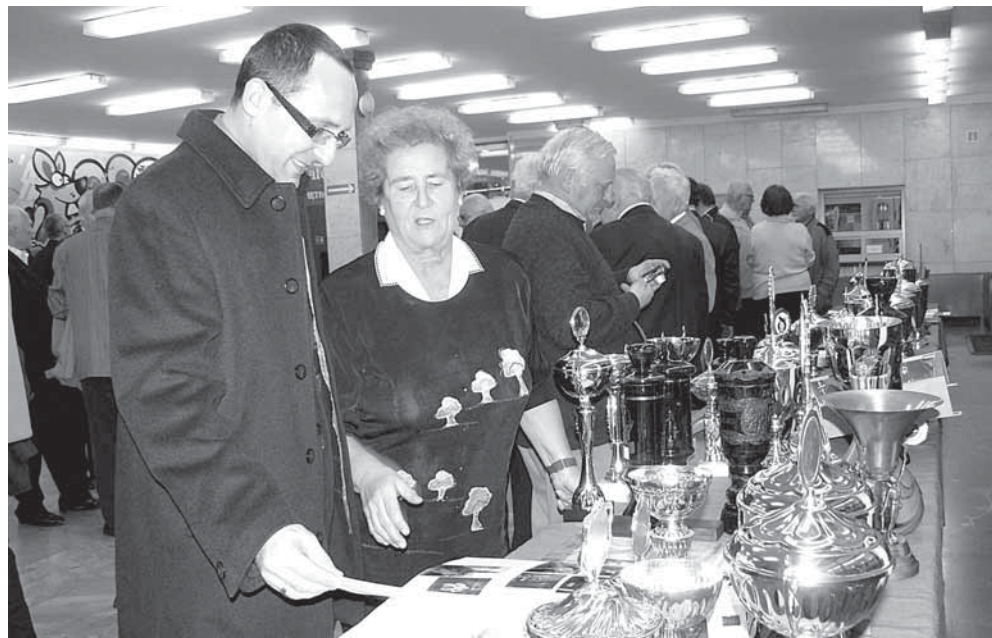
Obchodom 25-lecia Automobilklubu Tarnogórskiego towarzyszyła okolicznościowa wystawa, prezentująca osiągnięcia jego członków