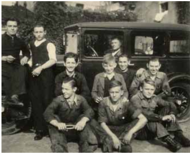
Zdjęcia z warsztatu samochodowego pochodzą z 1937 lub 1938 roku

Jeden z pierwszych warsztatów samochodowych w Tarnowskich Górach i zapomniana przez wielu stacja benzynowa w centrum miasta. Zostały uwiecznione na zdjęciach zrobionych przez ojca Urszuli Nowaczyk.