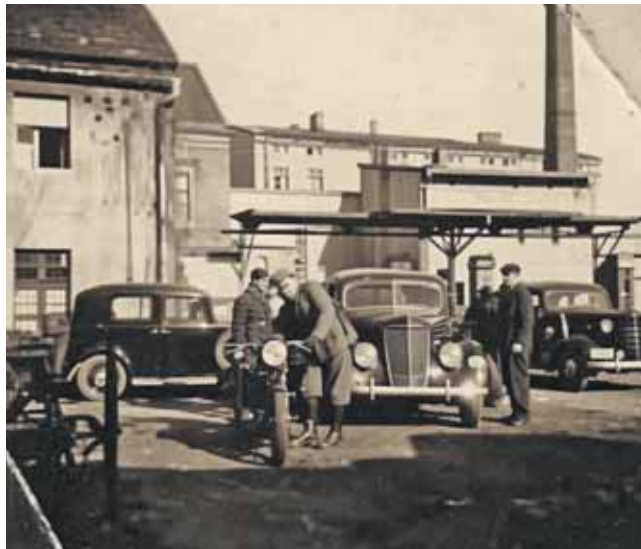
Historia uchwycona w kadrze