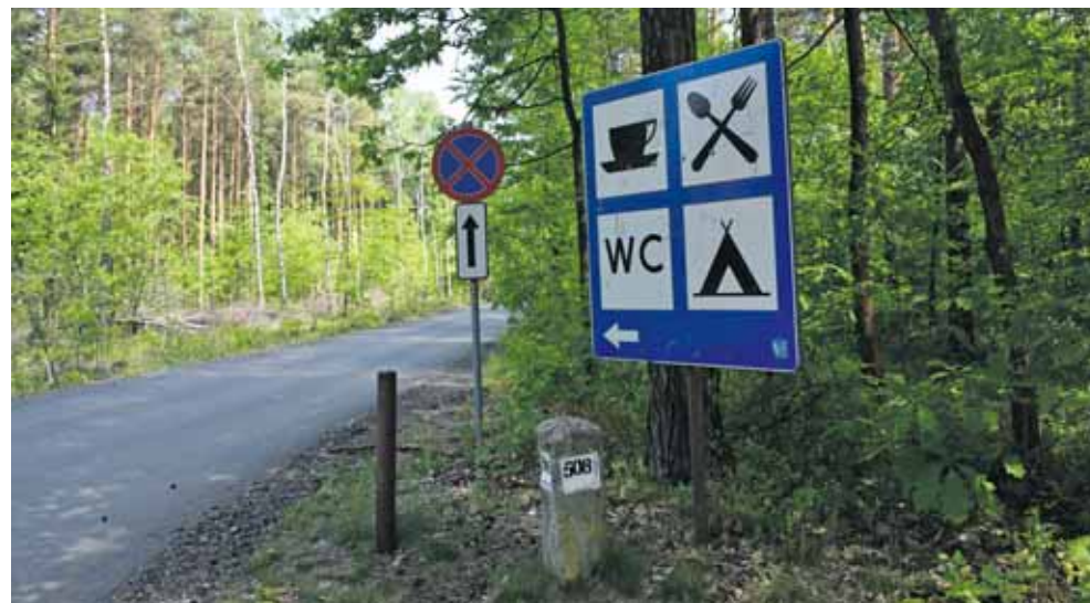
Zakończył się remont drogi prowadzącej do pola biwakowego nad zalewem Nakło-Chechło