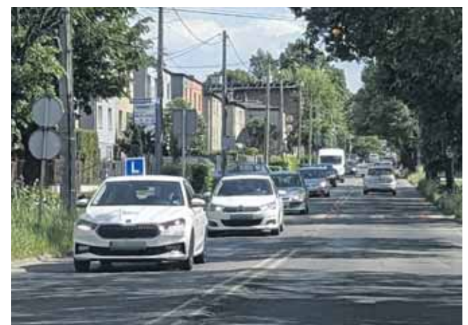
Ceny kursów idą w górę, stawka proponowana przez starostwo jest za niska