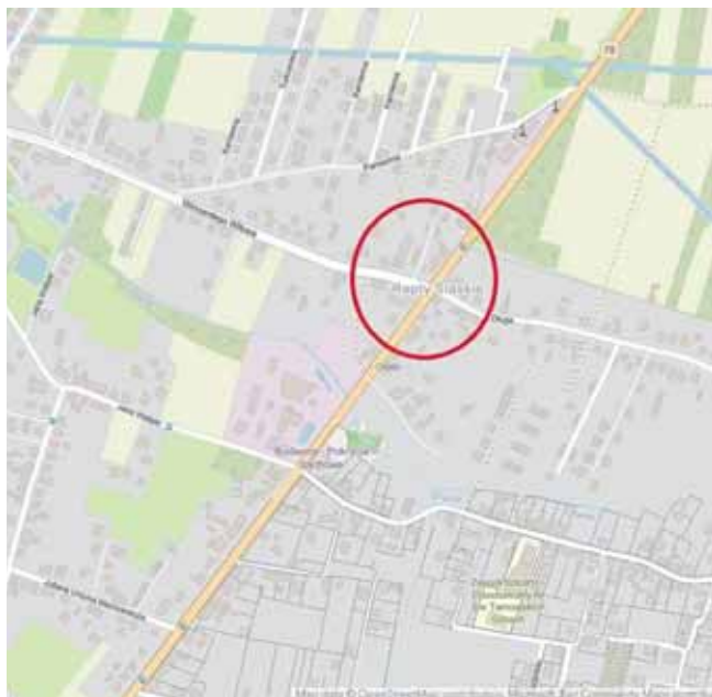
Od ubiegłego tygodnia w rejonie prowadzonych prac obowiązuje ruch wahadłowy

Zakres prac obejmuje przebudowę samego skrzyżowania oraz poprawę bezpieczeństwa i infrastruktury w jego otoczeniu. Po zakończeniu inwestycji skrzyżo-