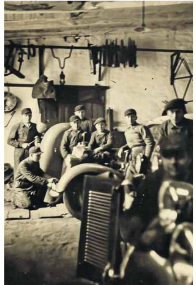
Warsztat działał w centrum Tarnowskich Gór

(ESP)