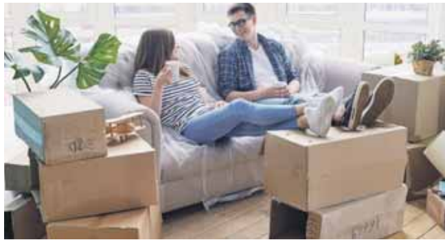
Także wśród Polaków wzrasta zainteresowanie wynajmem mieszkań

Jak twierdzi, pierwsze wyraźne zmiany na rynku nieruchomości zauważymy już jesienią, z kolei wiosną przyszłego roku przewiduje wysyp licytacji komorniczych domów. To czarny scenariusz, ale jak przekonuje nasz rozmówca, bardzo realny. Powodem jest oczywiście wzrost stóp procentowych: o ile grunty klienci