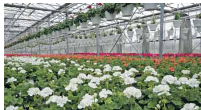
Aby kupione rośliny nadal wyglądały efektownie, należy zapewnić im odpowiednie podłoże i dobrej jakości nawóz

– Często popełnianym błędem jest wybór preparatu o dużej zawartości azotu. Azot przekłada się na wzrost zielonych części rośliny, ale nie pobudza kwitnienia. Kwiaty potrzebują potasu, którego w nawozie powinno być 2-3 razy więcej niż azotu, a także innych mikroelementów niezbędnych do prawidłowego rozwoju rośliny – podkreśla nasz rozmówca.