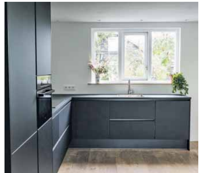
W przypadku kuchennych aranżacji dużo zależy nie tylko od samej wielkości pomieszczenia, ale i jego kształtu