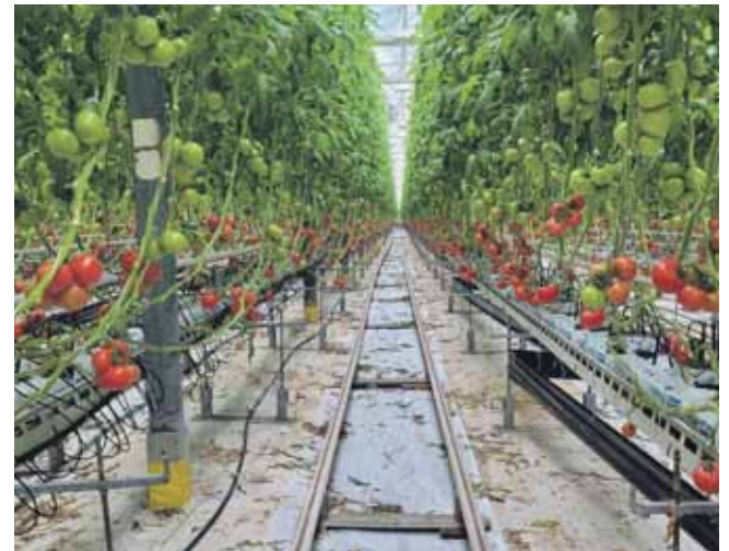
Pierwsze zbiory przypadają w okolicach połowy marca. Choć sezon kończy się w listopadzie, praca w szklarni trwa przez okrągły rok

– Klienci często nie wiedzą, że kupując pomidory malinowe, mogą natrafić na jedną z wielu odmian. Tylko w Polsce do rejestru COBORU wpisanych jest 9 głównych, a na świecie jest ich jeszcze więcej i wciąż powstają nowe. To, co łączy wszystkie dobrej jakości pomidory malinowe, to charakterystyczny kolor skórki, delikatny miąższ i to, że są lekko miękkie w porównaniu do tzw. pomidorów