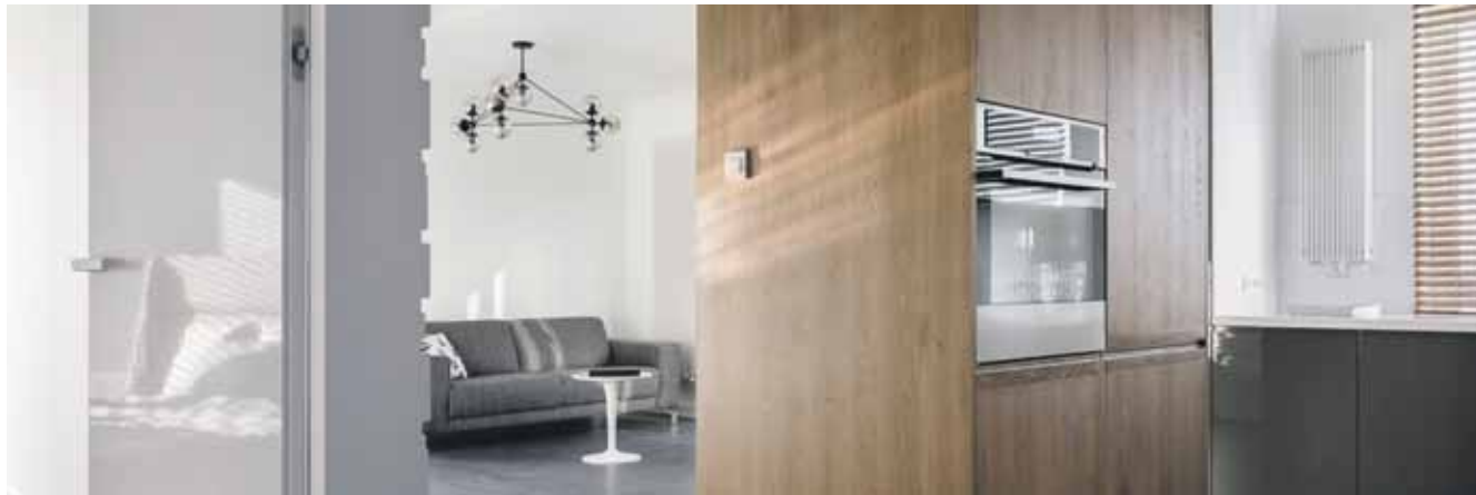
Kiedyś drewno, dzisiaj fornir. Prezentuje się elegancko i nowocześnie

Taki materiał nie ogranicza nas również szerokością wąskich listewek, a harmonijne połączenie paneli ściennych i podłogowych nie stanowi żadnego pro-