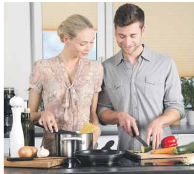
Ze względów bezpieczeństwa płyta grzejna powinna znajdować się w odległości minimum 50 cm od zlewu

Trudność może też stanowić wycięcie dwóch otworów w blacie zbyt blisko siebie. Zarówno w trakcie montażu, jak i później, już po remoncie, nadmiernie obciążony blat może po prostu pęknąć.