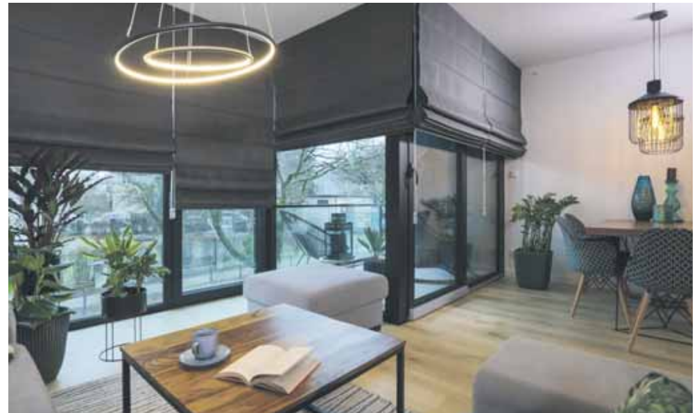
Rolety rzymskie wciąż są gorącym wnętrzkim trendem. Umożliwiają przysłonięcie dowolnej części szyby, można je też łatwo odczepić i wyprać

Ciekawym rozwiązaniem jest przesłonięcie dowolnego