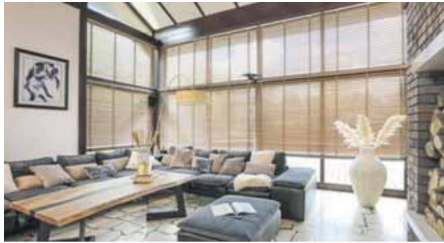
Żaluzje drewniane chętnie wybierają zwolennicy rozwiązań przyjaznych środowisku

Mniej odważnym, ale na pewno praktycznym rozwiązaniem będą rolety typu dzień-noc. Składają się z naprzemiennie ułożonych pasów materiału, z których jedne mają postać półprzezroczystej siatki, a drugie silnie ograniczają dopływ promieni słonecznych. Skutecznie chronią przed refleksami na ekranach monitorów. Występują w różnych wariantach, jak stosowane na poddaszach rolety dachowe lub te montowane na bocznych prowadnicach w przypadku okien uchylnych