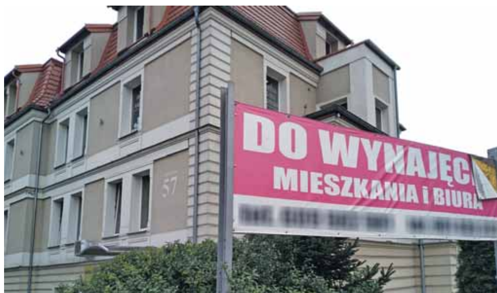
Wynajem będzie coraz bardziej opłacalny dla inwestorów – prognozuje pośrednik nieruchomości

trendach na lokalnym rynku nieruchomości. Pomijając to co oczywiste, w tym: wojnę na Ukrainie, wzrost rat kredytu i poważne zaostrenie wymagań przy ich udzielaniu, każdy klient to inna historia. Na pewno wzrosło zainteresowanie wynajmem nieruchomości. – Przychodzą nie tylko obywatele Ukrainy, którzy – mówiąc na marginesie – także są zainteresowani kupnem nieruchomości. Większe zainteresowanie wynajmem jest wśród Polaków – być może są to już pierwsze osoby, które nie mają zdolności kredytowej albo nie chcą się zadłużać przy rosnących kosztach