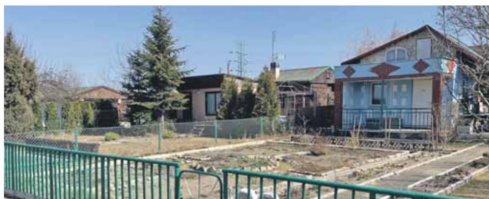
Co roku, wraz z nastaniem wiosny Polski Związek Działkowców otrzymuje wiele pytań dotyczących nabycia prawa do ogródka działkowego